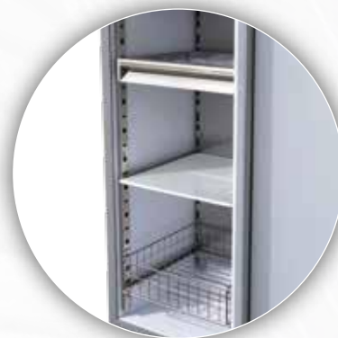
Divers aménagements possibles