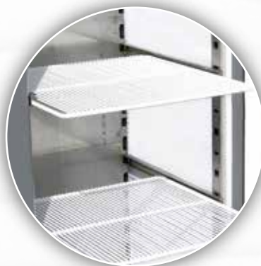
Clayettes en fil d'acier plastifié blanc